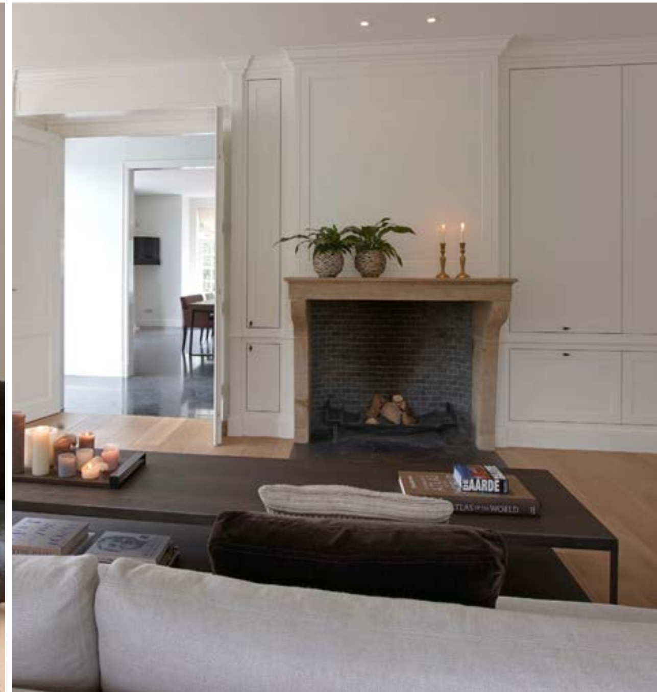
De woning op zich heeft dan wel een klassieke vormgeving, het interieur is eerder hedendaags met twee zachte zitbanken en een strakke houten salontafel. Op de vloer ligt een natuurlijke eiken parketvloer. Die benadrukt het vele licht dat in huis binnenstroomt.