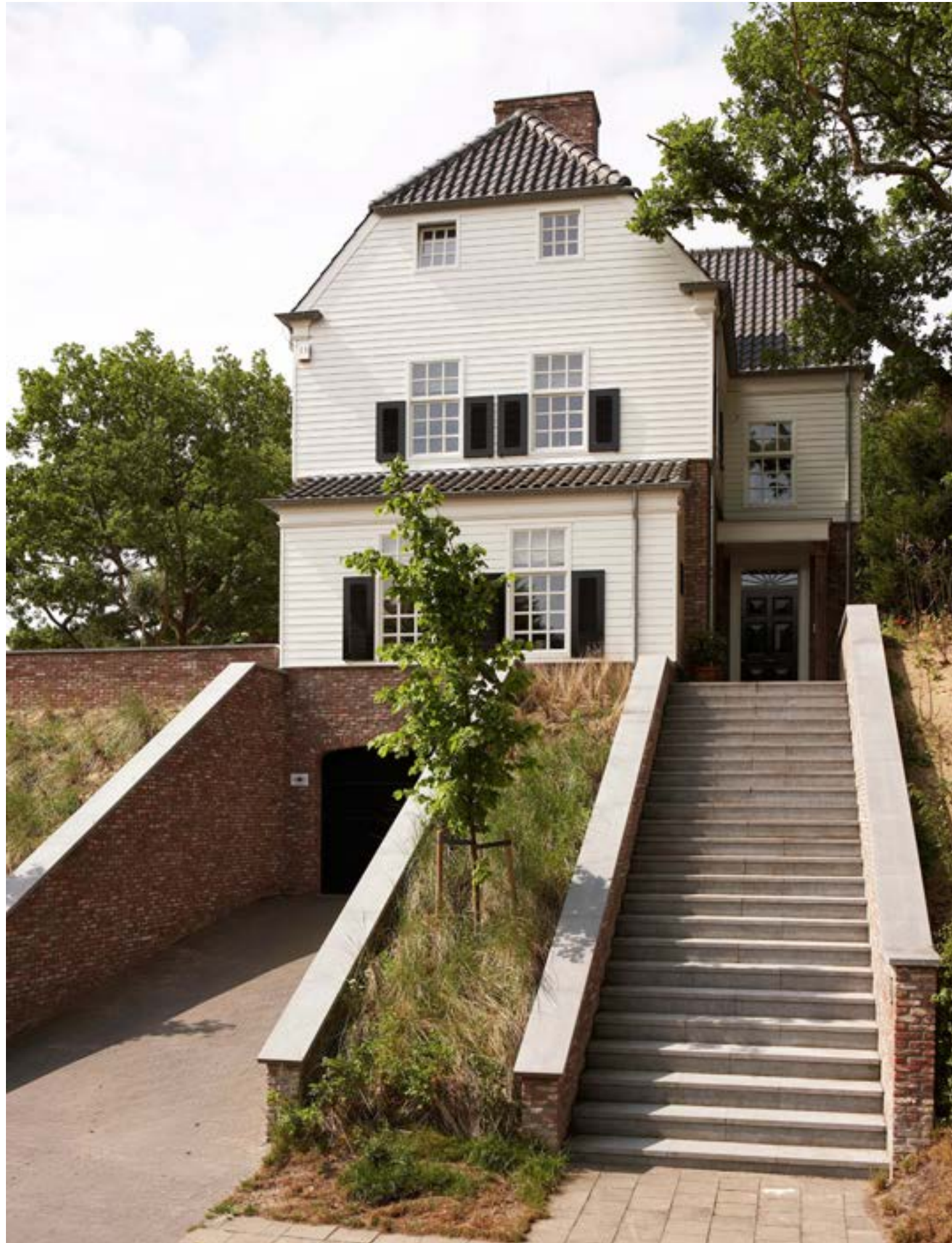
Omdat de woning op een duin ligt, bereiken bezoekers de voordeur via een trap van blauwe hardsteen. Naast de trap ligt de toegang tot de garage, die dus in de duin verborgen ligt.

De architect tekende een woning in typische Long Islandstijl: een hoog en statig huis met houten gevelbekleding in geschilderd meranti. Om de houten gevel minder monotoon te maken, voerde de architect het onderste deel van de gevel uit in baksteen, zodat de woning op een soort plint rust.