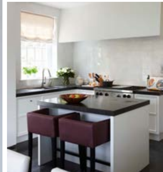
Omdat de bewoners van kleur houden, werden in de keuken bordeauxrode accenten gelegd: bijvoorbeeld in de maatkast waarvan de achterwand met behang is bekleed.