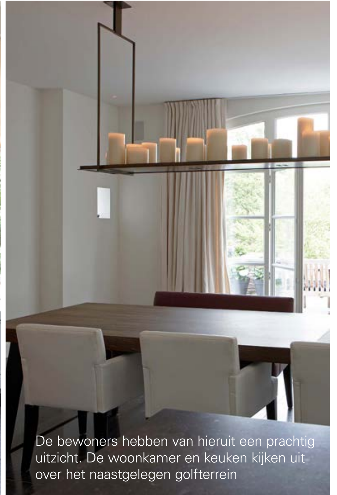
In het verlengde van de tafel zit een kaderloze open haard op gas. Een idee van de interieurarchitecte waar de bewoners meteen helemaal wild van waren. Boven de eettafel zorgt de bijzondere kroonluchter voor een perfecte aanvulling op het vuur.