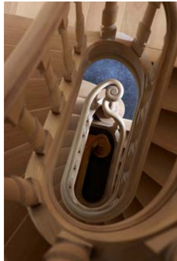
Foto links: het lijken kleine details, maar ze laten deze woning wel helemaal kloppen in haar stijl: het ossenoog met dievenijzer boven de afgeronde deuropening. Ook over de plaatsing van de grote hardstenen vloertegels werd nagedacht. De voegen lopen gelijk met de deur en zelfs met de deurstijlen. Alles werd dus ook op maat gemaakt. Foto midden: Vlassak-Verhulst maakte gebruik van stalen deuren. Staal is namelijk makkelijker uit te voeren met slanke profielen, wat de elegante uitstraling van de woning beter benadrukt. Deze deuren bakenen de hal af van de leefruimten. Foto rechts: de eikenhouten trap die van de kelderverdieping tot helemaal boven leidt, werd erg gedetailleerd uitgevoerd. De leuning loopt in een stuk door.

een comfortabel ligbad. Langs de slaapkamer hebben de bewoners ook directe toegang tot hun eigen kleedkamer. Op deze verdieping bevindt zich verder ook nog een werkkamer – handig wanneer de bewoners thuis nog moeten doorwerken – een hobbykamer en een wasplaats. Overal werden kasten op maat gemaakt, met originele details als paneeldeurtjes en kroonlijsten. Ook rond de ramen werden vaak kasten gebouwd, die bijvoorbeeld dienstdoen als boekenschap en die meteen ook de radiatoren aan het zicht onttrekken.