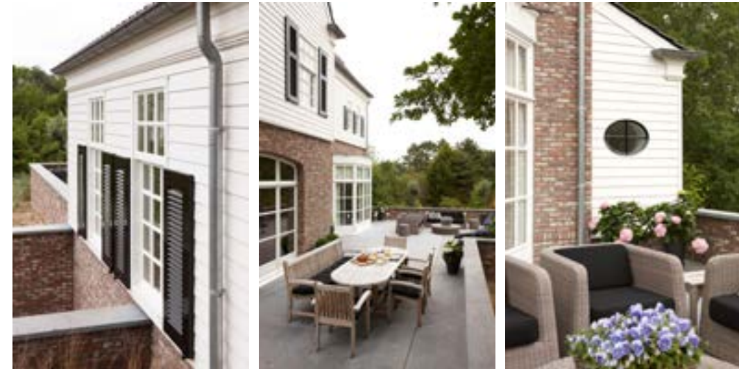
Foto midden: De leefkeuken en zitkamer komen beiden uit op een groot terras in hardsteen. De toegangsdeuren kunnen volledig open, zodat buiten ook een beetje naar binnen komt. Van hieruit kijken de bewoners uit op het golfterrein, maar dankzij de borstwering kunnen voorbijgangers hen niet zien zitten. Ook hier werd aan de kleine details gedacht: een lijngootje ter breedte van een voeg zorgt voor de afwatering.

De architect tekende een woning in typische Long Islandstijl: een hoog en statig huis met houten gevelbekleding in geschilderd meranti. Om de houten gevel minder monotoon te maken, voerde de architect het onderste deel van de gevel uit in baksteen, zodat de woning op een soort plint rust.