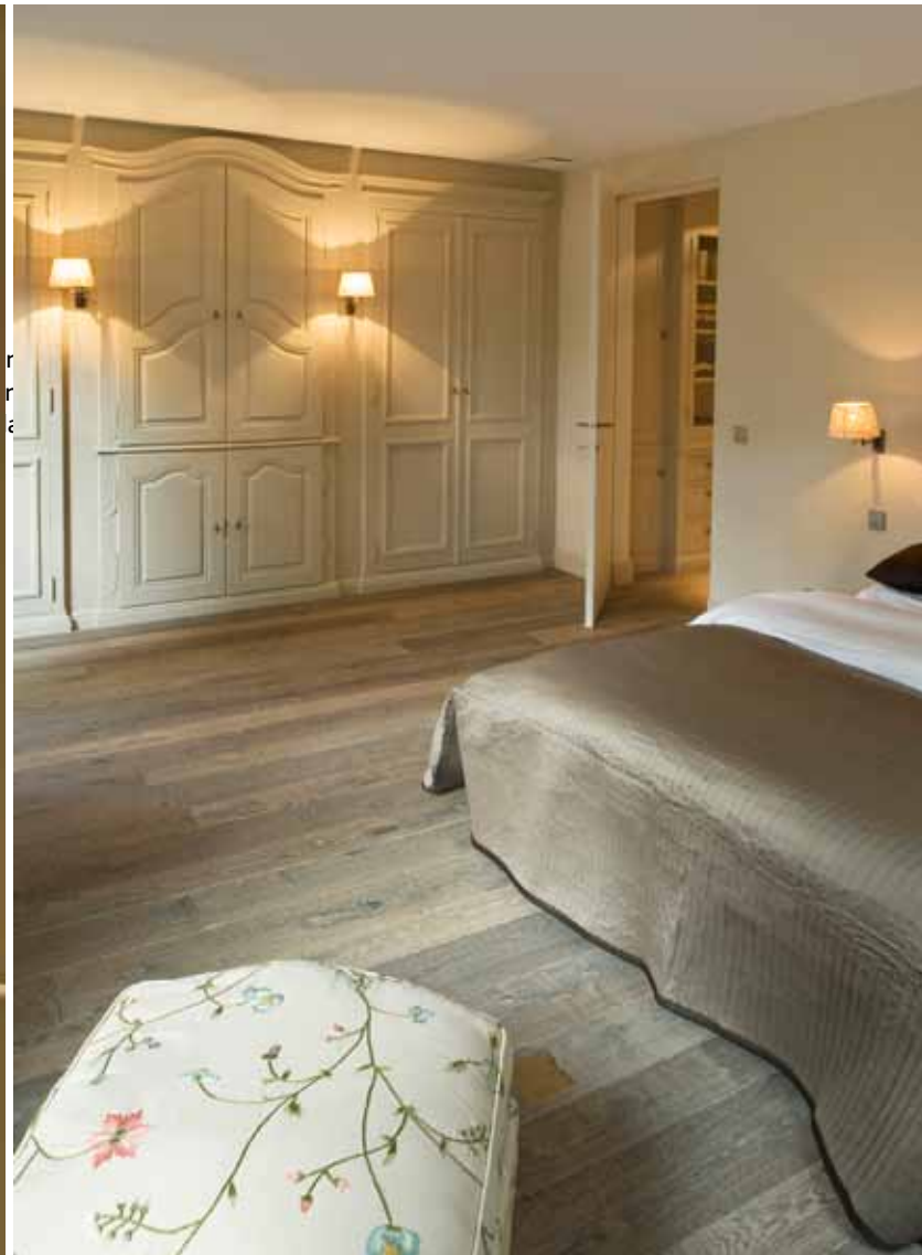
Foto rechts: ook in de slaapkamer voeren rustige ton-sur-ton tinten de boventoon. De kast werd volledig op maat gemaakt.. Foto rechterpagina: in de ouderbadkamer is de marmersoort Gris d'Ardenne Doré gebruikt. De platen zijn persoonlijk uitgezocht en door de bouwverwerf op maat gezaagd en verwerkt.

gekozen om hun stijl en vakmanschap, maar de materialen in het interieur wilden we zelf kiezen. Ook hebben we de Belgische interieurbouwer Francis van Damme ingeschakeld, die alle maatwerkkasten en de keuken heeft ontworpen en gemaakt." Het afstemmen van al deze onderdelen begon al ruim voor de bouw. De indeling van de woonkamer werd zelfs helemaal afgestemd op de laat achttiende-eeuwse marmeren schouw die het echtpaar in België had gevonden. Bij het ontwerp van dit huis is daar al rekening mee gehouden. De meubelmaker maakte de kast naast de schouw van oude kastonderdelen, aangevuld met nieuwe delen die oud werden gemaakt. In de volgende ruimte, de werkkamer, wijst Hannie ons op de ingekraste tekens in de vroeg achttiende-eeuwse schouw. "Deze tekens moesten de heksen op afstand houden. En zie je die kleine, rond gemetselde steentjes van de achterwand? Die worden goudklompjes genoemd, omdat ze zo zeldzaam zijn."