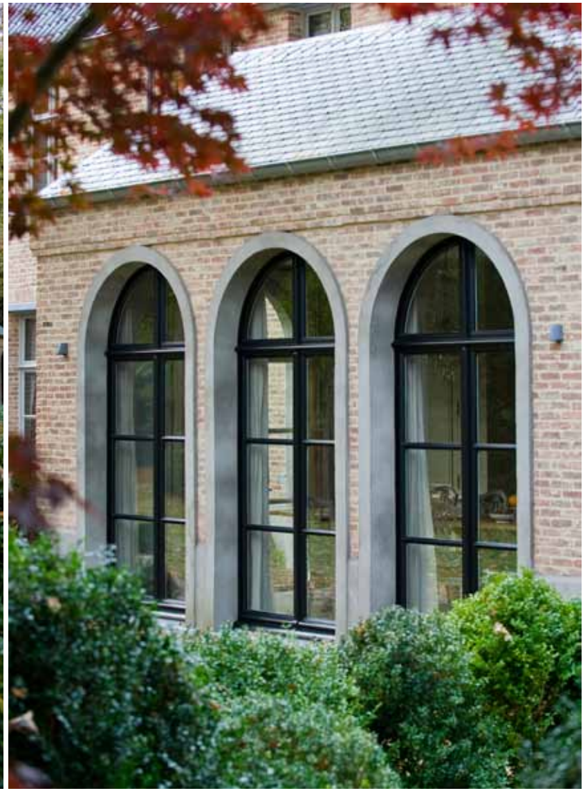
De statige ritmiek, sobere raamomlijstingen in gecementeerde bepleistering en de sobere kleurstelling van de verschillende dakmaterialen geven het huis een voornaam uitstraling. De materialen die hiervoor zijn gebruikt, zijn oude stenen, rijk gedecoreerd natuursteen, zinken dakgoten en regenpijpen en smeedijzeren hekwerken. De buxusbollen in de tuin complementeren de statige uitstraling.