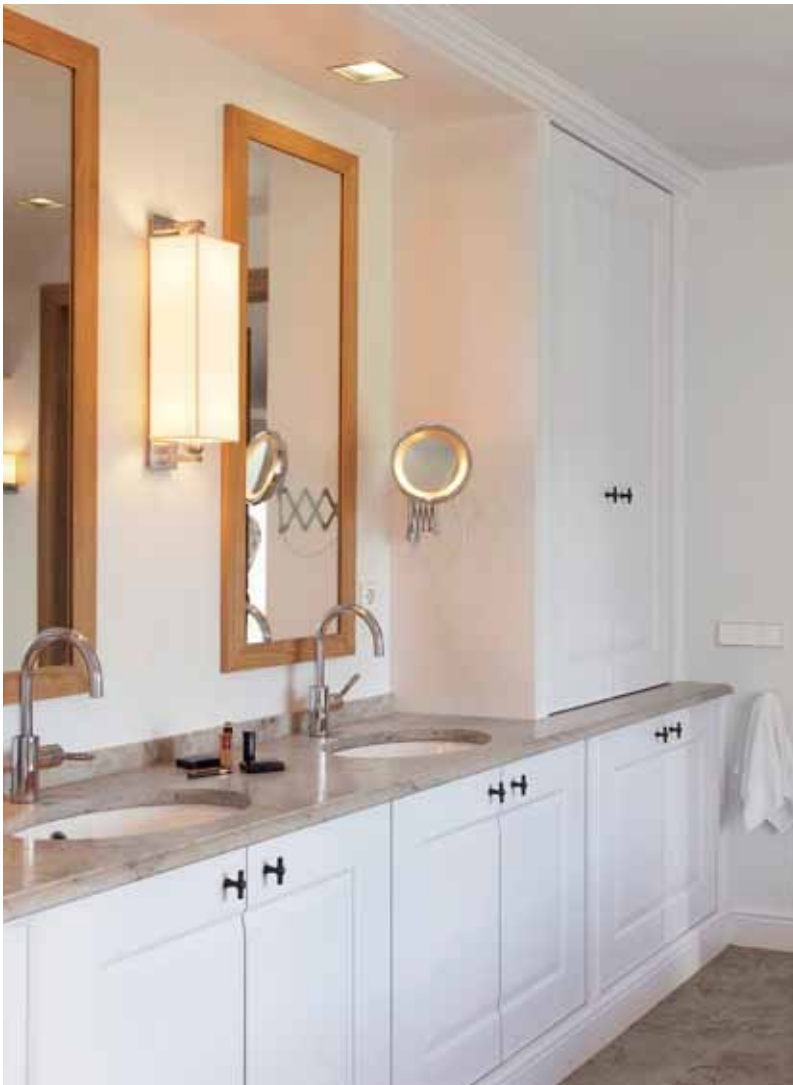
Photo ci-dessous : depuis la baignoire, les habitants jouissent d'une vue magnifique sur les prairies. Pour le sol et les murs, Didi et son mari ont choisi une pierre naturelle adoucie (Jura Grau). Le meuble lavabo est en MDF et mélamine.